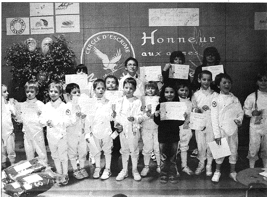
Les nouveaux diplômés