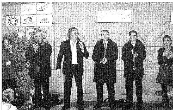
L'heure des discours avec les personnalités du CDOS, Jeunesse et Sports et du club