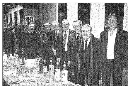
L'heure du buffet pour les personnalités mais avec du « Pacific » sans alcool pour les sportifs